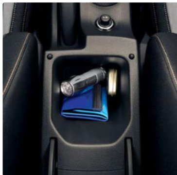
“Jumbo Box” en el reposabrazos central