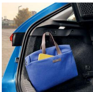
Ganchos para bolsos en el maletero