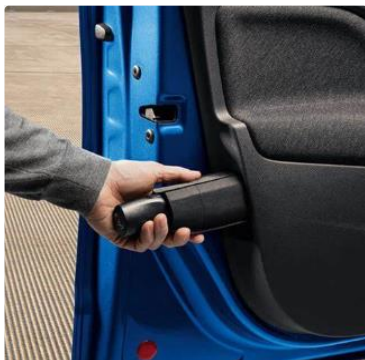
Paraguas en la puerta del conductor