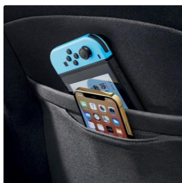
Bolsillos en el respaldo de asientos delanteros