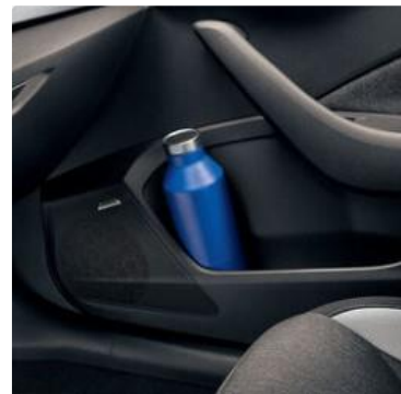
Porta botellas en todas las puertas